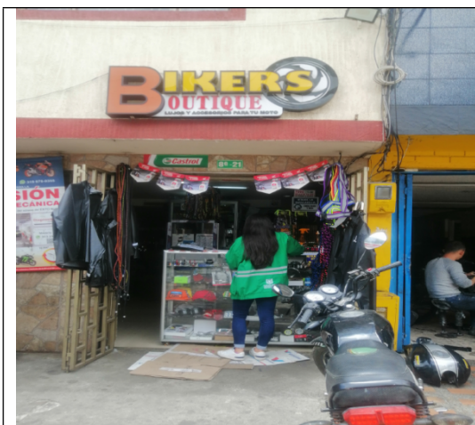
Foto 1. Vista general del establecimiento.

(...) 5. SITUACIÓN ENCONTRADA/ REVISIÓN DOCUMENTAL: