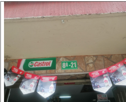
Foto 3. Vista general de la nomenclatura.