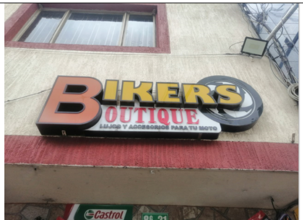
Foto 2. Vista general de Publicidad Exterior Visual.