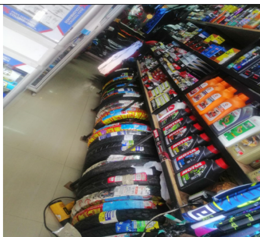
Foto 2. Vista general del Acopio de llantas.